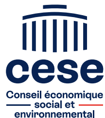
Format étroit type kakémono (80 cm x 200 cm)